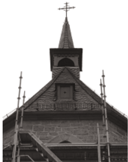
nach der Sanierung