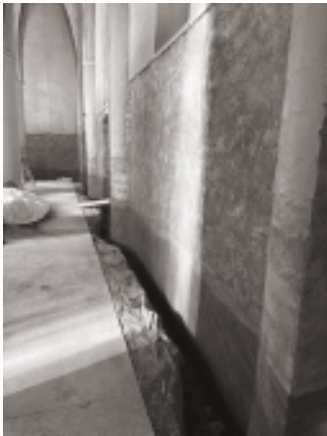
Nordseite Sanierung des Mauerwerk und Dichtschlämme im Sockelbereich

Das neu sanierte und verfugte Mauerwerk erhielt im Sockelbereich vor dem weiteren Putzauftrag umlaufend an der Nord-, West- und Südfassade eine Dichtungsschlämme.