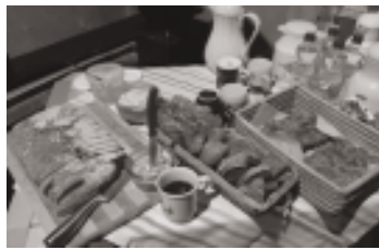
Hunger nach Glauben