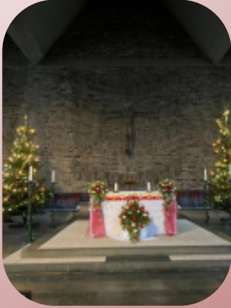
Von den indischen Schwestern geschmückter Altar in der Montfortkirche