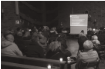
(Ver)-Gib Dir Was