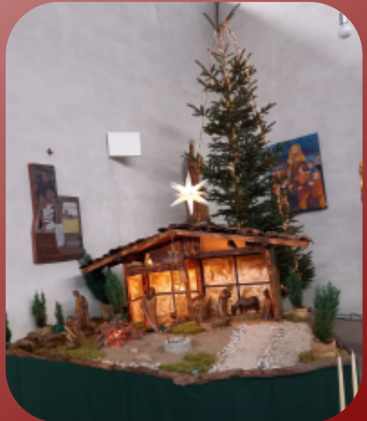
Krippe St. Hedwig Nochen