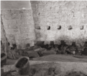
Beispiel der Schäden am Mauerwerk

Der freigelegte Mauersockel zeigte an der Süd- und Westfassade mehrere Fehlstellen im Steingefüge. Im Bereich der Nordfassade ist ein ca. 50 cm hoher und ca. 25 cm tiefer Streifen des Sockelmauerwerks durchgehend geschädigt. Die geschädigten Bereiche wurden im Januar 2026 mit ca. 1.200 Grauwacke Steinen neu aufgebaut.