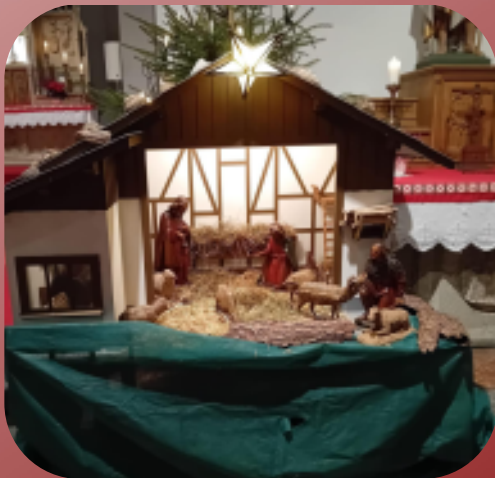
Krippe St. Johannes Baptist Gimborn

Vielen Dank an alle Krippenbauer für ihre Mühe und die schöne Gestaltung der Krippen in unseren Kirchen!