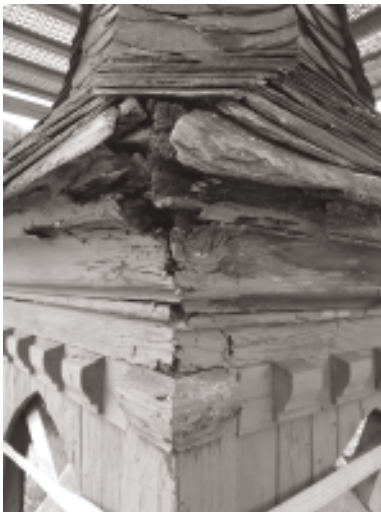
vor der Sanierung